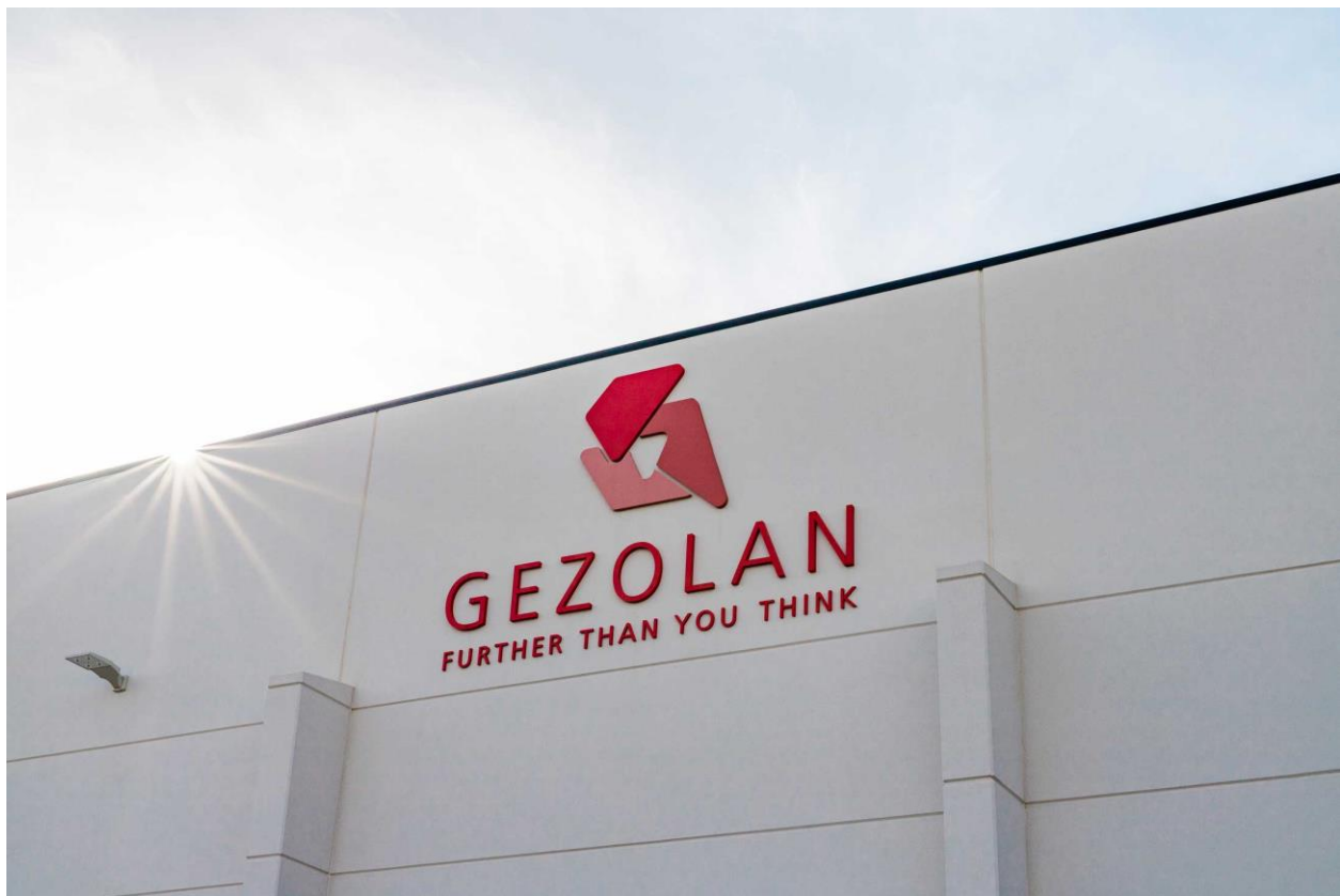
Aussenansicht des neuen Produktionsstandortes in Buford, GA (USA)

Zeichen inkl. Leerzeichen: 2.153, sofort frei zur Verwendung